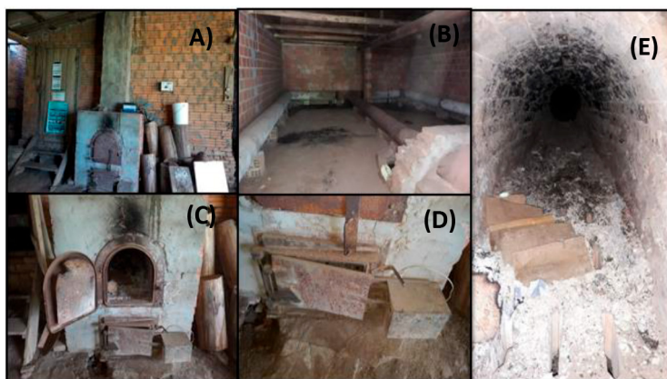
Figura 2. Unidade de cura Convencional (A); área interna da unidade de cura (B); parte externa da fornalha (C); abafador (D); interior da fornalha (E)

Por fim, a capacidade de secagem da unidade de cura foi calculada pela Equação 4: