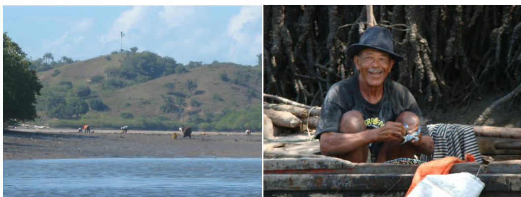
Figura 1. Esquerda: Atividade de coleta de moluscos (mariscagem) em uma planície de maré no estuário do Rio Subaé, Baía de Todos os Santos. Direita: Pescador no estuário do Rio São Paulo, Baía de Todos os Santos

Animais bentônicos possuem um papel fundamental não somente para o funcionamento dos ecossistemas como também para a sociedade humana. Um grande número de populações humanas costeiras como, por exemplo, na costa NE e N do Brasil, praticam além da pesca, a mariscagem (coleta de moluscos) em planícies de maré e em manguezais para seu sustento e sobrevivência (Figura 1). 3 Adicionalmente, recifes de corais e recifes rochosos submersos são reconhecidamente importantes áreas de pesca para muitas comunidades humanas. 4,5