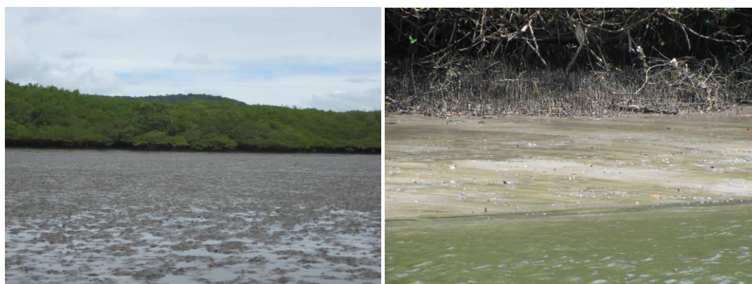
Figura 5. Planícies de maré nos estuários do Rio Paraguaçu (esquerda) e Jaguaripe (direita) na Baía de Todos os Santos

Um dos estudos do Projeto BTS investigou as assembleias bentônicas das planícies de maré ao longo dos gradientes estuarinos dos rios Jaguaripe, Paraguaçu e Subaé. 29 Os resultados indicaram que existe um padrão similar de estrutura e composição das assembleias macrobentônicas entre os maiores estuários da BTS e que a salinidade foi a variável com maior importância. A riqueza dos táxons diminuiu da região do estuário inferior para o estuário superior, concordando com os padrões obtidos para as assembleias do infralitoral estuarino da BTS. 19,29