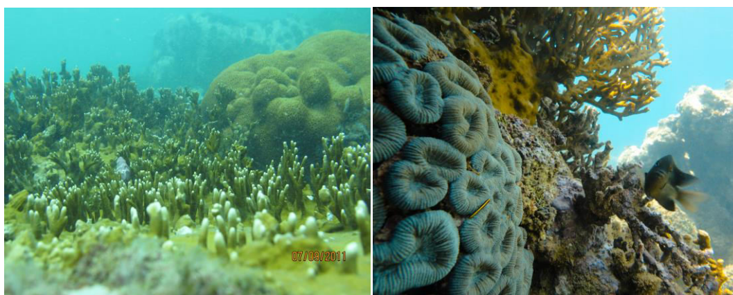
Figura 6. Recifes de coral na Baía de Todos os Santos

remobilização devido a ações de ondas e correntes, permitindo assim a cimentação destes nos recife. Os recifes de corais são um dos ecossistemas de maior biodiversidade e produtividade dos oceanos. 30 Na BTS os recifes encontram-se principalmente em duas regiões, a nordeste, entre a Ilha dos Frades e a Cidade de Salvador e na costa leste da Ilha de Itaparica (Figura 6). 31