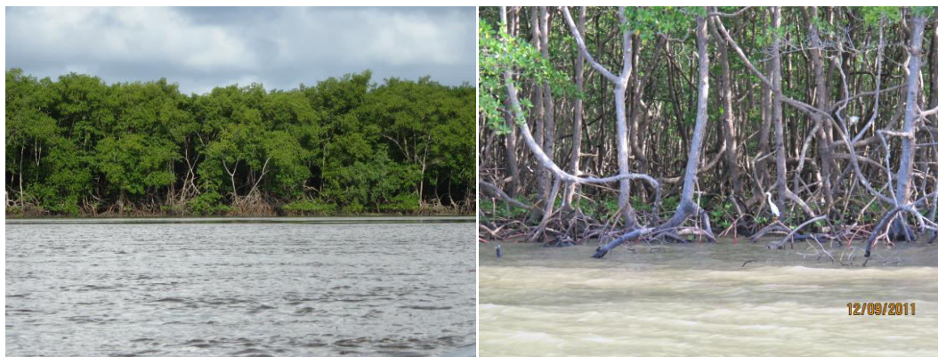
Figura 4. Trechos de manguezal no estuário do Rio Jaguaripe (esquerda) e do Rio Jaguaripe (direita), Baía de Todos os Santos

Planícies de maré são ambientes localizados em regiões entremarés e ocupam grande parte de ambientes estuarinos e costeiros por todo o globo (Figura 5). 25 Estes habitats são caracterizados por sofrerem inundações periódicas devido à variação das marés. São locais de transição entre ambientes aquáticos e terrestres, onde seu limite estende-se até o ponto máximo da amplitude das marés ou até onde ocorra presença de cobertura vegetal (e.g. marismas, manguezais). Em ambientes estuarinos, as planícies de maré são locais muito dinâmicos e são primariamente estruturados pela interação com fatores físicos como direção dos ventos, ação das ondas, movimentos das marés e correntes, transporte de sedimento, entre outros. 26 Nestes ambientes, devido à alta retenção de nutrientes e compostos como matéria