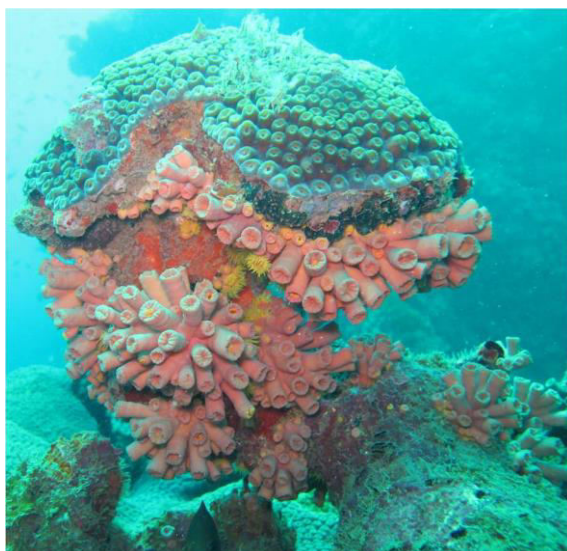
Figura 7. Coral invasor Tubastraea tagusensis e coral nativo Montastrea cavernosa em recife de coral da BTS

e assim teriam, em uma escala evolutiva, um maior desenvolvimento de suas defesas químicas. O coral Tubastraea produz metabólitos secundários, como estearato de metila ( C_{19}H_{38}O_2 ) e palmitato de metila ( C_{17}H_{34}O_2 ), que podem provocar danos em algas e em outros invertebrados bentônicos, além de inibir a predação por peixes generalistas. 53 Além disso, o coral nativo Mussismilia hispida sofre necrose tecidual quando encontra-se próximo (<5cm) ao coral Tubastraea spp. 49 Os efeitos do coral Tubastraea foram descritos para costões rochosos e alguns estudos estão sendo realizados para avaliar como os recifes de coral da BTS vão reagir.